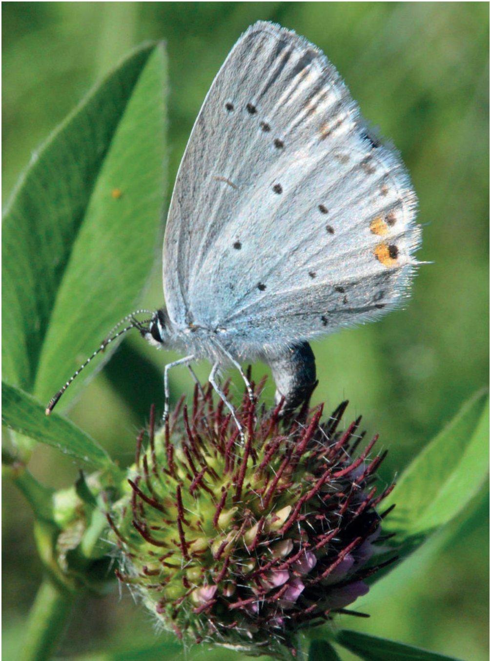
Abb. 1: Ein Weibchen des Kurzschwänzigen Bläulings ( Cupido argiades) bei der charakteristischen Eiablage in ein noch nicht aufgeblühtes Blütenköpfchen des Rotklee ( Trifolium pratense ;).