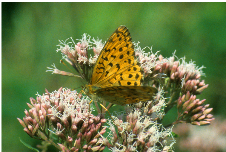
Abb. 3: Die größte Sensation der im Forstrevier Ludweiler im Warndtwald beobachteten seltenen Lichtwaldarten war der Brombeer-Perlmutterfalter ( Brenthis daphne ) – siehe auch gesonderter Beitrag in diesem Band (ULRICH 2006a).