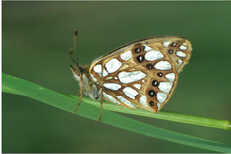
Abb. 1: 2003 fast allgegenwärtig, der Wander-Perlmutterfalter ( Issoria lathonia )