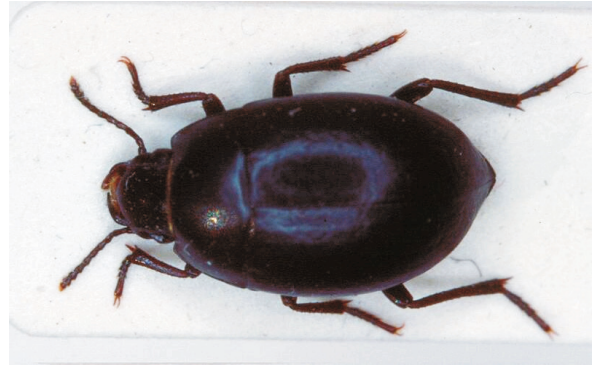
Abb. 14: Oxycara (Symphoxycara) hansbremeri LILLIG, 2001, Paratypus (7,5 mm)