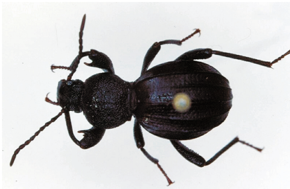
Abb. 15: Scaurus pevelingi LILLIG, 1995, Paratypus (13,5 mm)