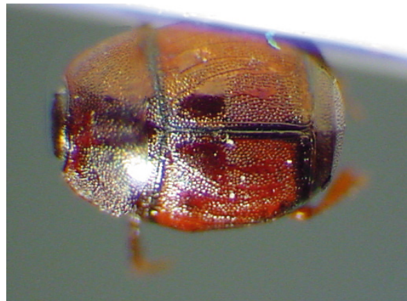
Abb. 4: Hypocacculus (Nessus) tessellatus VIENNA, 1993, Paratypus (2,0 mm)