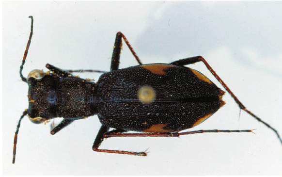
Abb. 1: Euryarthron nageli CASSOLA, 1985, Paratypus (13 mm)