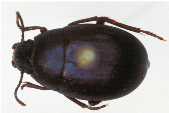
Abb. 11: Oxycara (Symphoxycara) nageli LILLIG, 2001, Paratypus (8,0 mm)