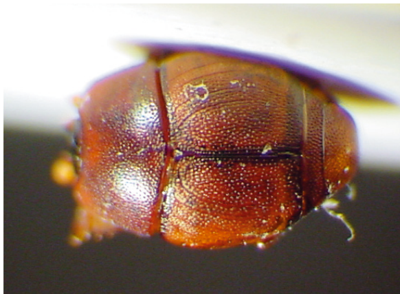
Abb. 5: Hypocacculus (Nessus) rugosissimus VIENNA, 1993, Holotypus (2,1 mm)