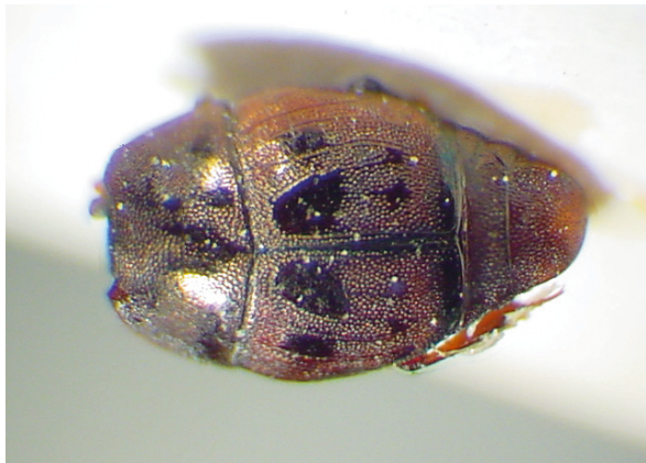
Abb. 3: Hypocacculus (Nessus) multisphacellatus VIENNA, 1993, Holotypus (2,5 mm)