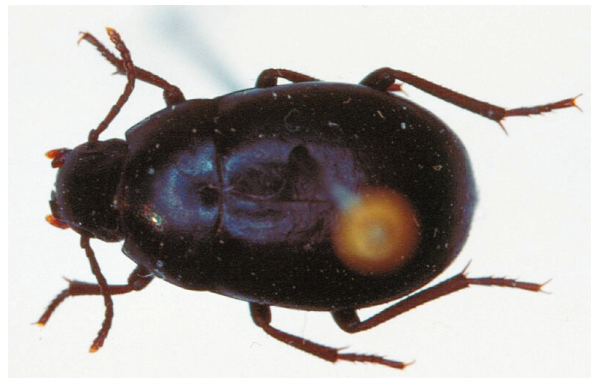
Abb. 12: Oxycara (Symphoxycara) peyerimhoffi LILLIG, 2001, Paratypus (7,9 mm)