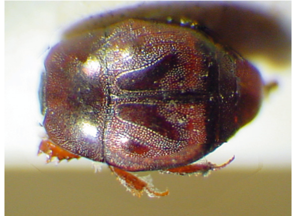
Abb. 2: Hypocacculus (Nessus) weyrichi VIENNA, 1993, Holotypus (2,5 mm)