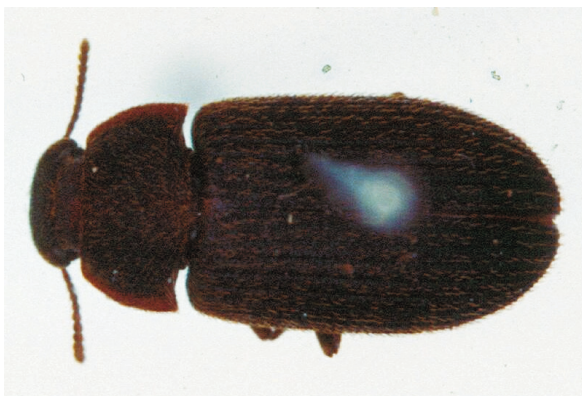
Abb. 17: Mesomorphus confusus FERRER, 2000, Paratypus (6,6 mm)