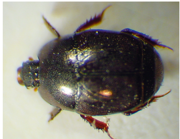
Abb. 6: Hypocacculus (Nessus) intermedius VIENNA, 1993, Paratypus (3,0 mm)