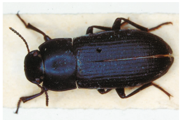
Abb. 12: Oxycara (Symphoxycara) peyerimhoffi LILLIG, 2001, Paratypus (7,9 mm)