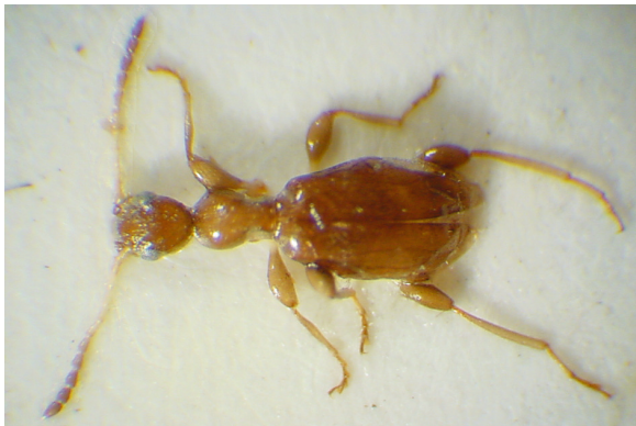
Abb. 9: Formicomus nageli UHMANN, 1990, Holotypus (2,9 mm)