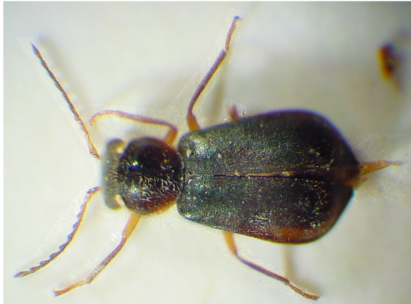
Abb. 7: Afroebaeus nageli (EVERS, 1987), Holotypus (3,0 mm)