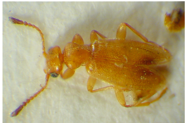
Abb. 10: Cordicomus claviger UHMANN, 1990, Holotypus (2,9 mm)