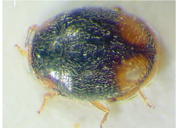
Abb. 8: Nephus (Sidis) weyrichi FÜRSCH, 1992, Holotypus (1,3 mm)