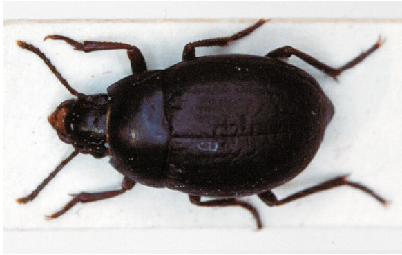
Abb. 13: Oxycara (Symphoxycara) evae LILLIG, 2001, Paratypus (7,0 mm)